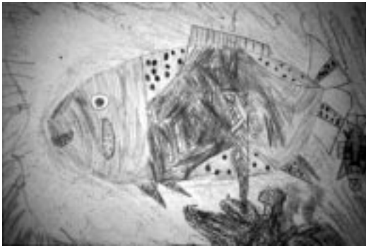
解剖後、再び子どもたちが描いた魚の絵

もっとも、そういう子どもの脳も心配だが、一部のデータだけで安易に結論を出す脳科学者の「データ脳」にも、問題がないとはいえない。だいたい、科学の新説というのは、たいてい数年、あるいは数十年でくつがえされる。かつて「科学では「当たり前」とされていたことが、いつか古い過ちとされ、葬り去られる。ならば現在まかり通っている説のほとんども、いつか別の説にとって代わられるのだ。だからゲーム脳をめぐる説も、鵜呑みにしすぎるのはよくない。だいたい、なんでもやりすぎれば脳によくないことくらい、誰にでもわかる。本だって、読みすぎれば目が悪くなるし、現実離れた机上の空論家になりかねない。だから本を読むのは悪