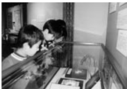
現代産業科学館に来館する子どもたち

間もなくプログラムが実施される。子どもたちはどんな顔をして、何を一番伝えたいと思っただろうか。下級生はどんな顔で話を聞き、どんな反応を示すのだろうか。自分がやる以上に興味がいってくる。