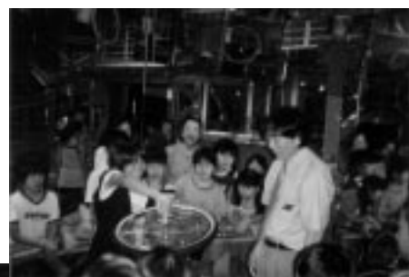
国立科学博物館でのワークショップ